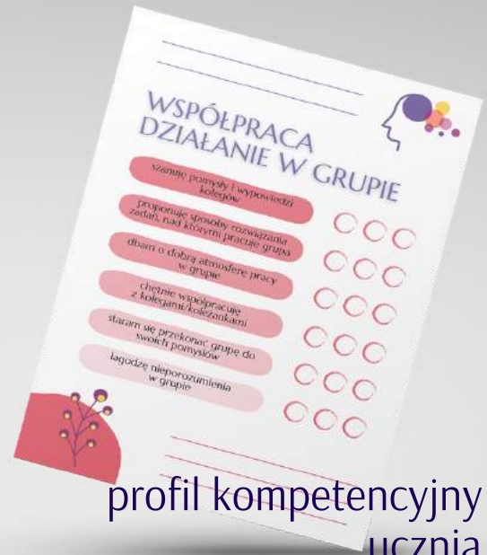
profil kompetencyjny ucznia