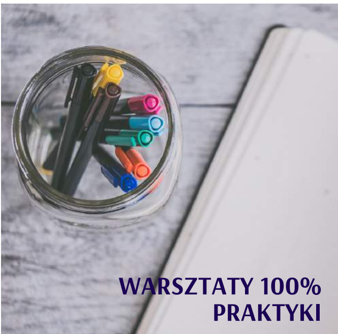
WARSZTATY 100% PRAKTYKI