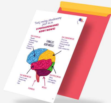
autorskie narzędzia edukacyjne