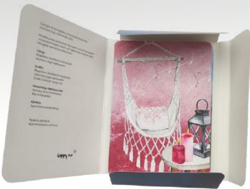
Karty Dobrostanu Happy Me™